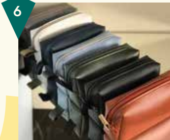
Fraenck Beekstraat 30

Een stop speciaal voor mannen: bij Neighbourhood vind je kleding en lifestyle producten voor mannen. Als tegenreactie op het huidige modesysteem, gaat Neighbourhood alleen voor de beste kwaliteit. Je loopt gegarandeerd met een perfect passend en duurzaam kledingstuk naar buiten.