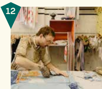
FUNDIES Klarendalseweg 96

Bij Froufrou's ontdek je een kleurrijke en bijzondere mix van vintage & nieuwe woonaccessoires, kleding, meubels en meer. Naast de vintage pareltjes vind je hier bijvoorbeeld ook retro Kit-Cat klokken uit Amerika en items van lokale makers zoals Studio Bolder. Voor jong en oud is hier wel wat te vinden of te beleven!