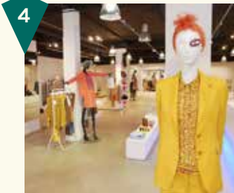
Spijkers en Spijkers Weverstraat 33A

Bij Minouche en Rûne kun je terecht voor elegante en unieke sieraden: er wordt over alles nagedacht, maar niks wordt 'bedacht'. Hier worden iedere dag juwelen met de hand én met veel gevoel en aandacht gemaakt, in het inmiddels herkenbare Minouche en Rûne-design.