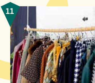
Froufrou's Sonsbeeksingel 102A

Stap binnen bij Aarden. De plek waar mooie maatkleiding met een verhaal en een betere wereld samenkomen. Jouw wensen en behoeften gaan hier hand in hand met het maken van de bewuste keuze voor duurzame mode die perfect past bij wat jij uit wilt stralen, terwijl je een positieve impact op onze wereld maakt.