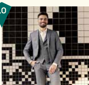
Aarden Sonsbeeksingel 147

SPYK71 is een woonwinkel in het Spijkerkwartier met een bijzondere mix van mooie, eigentijdse stijlen. Behalve meubels en woonaccessoires biedt deze winkel ook Dutch Design, verrassende kunst en originele cadeaus. SPYK71 heeft daarnaast een team creatieve stylisten in huis die je kunnen helpen met interieuradvies voor je woning of kantoor.