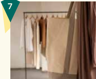
Hul le Kes Store Wezenstraat 5

Duurzaam, sociaal en lokaal, dat is Fraenck. De ontwerpen hier zijn strak en gemaakt van restmateriaal en snijverlies. In de winkel kun je niet alleen goed alleen shoppen, je ziet in de sociale werkplaats ook hoe jouw items gemaakt worden. Op deze manier krijgen mens én materiaal een tweede kans.