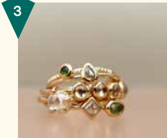
Minouche & Rûne Eiland 8

Trix en Rees kleding is van Arnhemse bodem en kenmerkt zich door hun mooie eenvoud. Hier geldt: de stof bepaalt het kledingstuk. Intuïtief en puttend uit ervaring, componeren zij de stukken. Eerst de ziel, dan de vorm. De kleding wordt in kleine oplage gemaakt. Naast de eigen collectie verkopen ze ook een aantal andere labels en product designers.