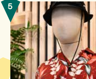
Neighbourhood Rijnstraat 14B

Spijkers en Spijkers is het modelabel van tweelingzussen Truus en Riet Spijkers, met een eigen winkel in de Arnhemse binnenstad. Bij Spijkers en Spijkers vind je intelligente en duidelijk ontworpen dameskleding. De ontwerpen zijn avant-garde met een zekere tijdloosheid. Leuk weetje: koningin Máxima draagt regelmatig creaties van Spijkers en Spijkers.