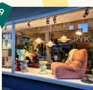
SPYK 71 Steenstraat 71

Met een eigen kijk op mode en kleding biedt Eigen Stijl een kleurrijk assortiment met vrolijke prints en goede basisitems. Merken met aandacht voor duurzaamheid zijn erg belangrijk. Naast kleding heeft Eigen Stijl sieraden, schoenen en accessoires in het assortiment. Eigen Stijl heeft meer winkels: Eigen Stijl Boetiek (Steenstraat 66B) en Eigen Stijl Arnhem (Steenstraat 75) en Eigen Stijl 2e kans (Steenstraat 66b).