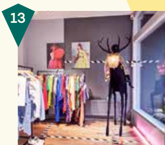
Begane Grond Klarendalseweg 476

FUNDIES is de winkel voor een kleurrijke outfit! Bij FUNDIES kun je terecht voor ondergoed, trainingspakken maar natuurlijk ook een op maat gemaakte galajurk. Alles met een kleurrijke knipoog, gemaakt van left-over stoffen van de mode-industrie. Zo probeert FUNDIES maatschappelijke inclusie op een duurzame manier aan te jagen.